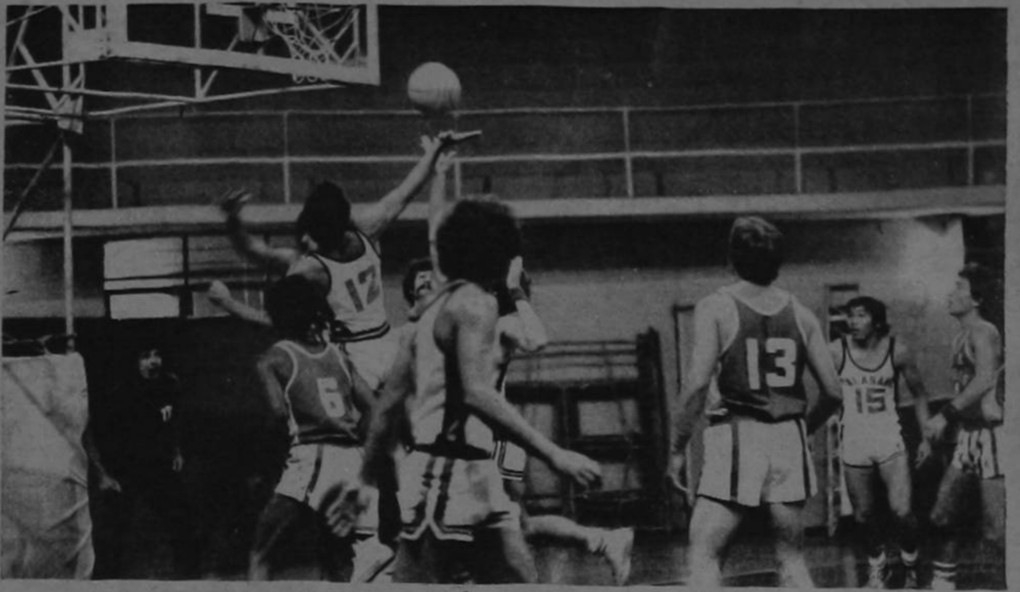
JUEGO AGRADABLE.- A pesar de la diferencia en puntos a favor angelino, fue un bonito encuentro. Aquí Pacheco y Contreras del Calasanz disputan debajo del aro con Martínez y Goulborne del Angeles.

La fecha del próximo viernes será entre San Luis - Pérez Zeledón y Amón- Seminario.