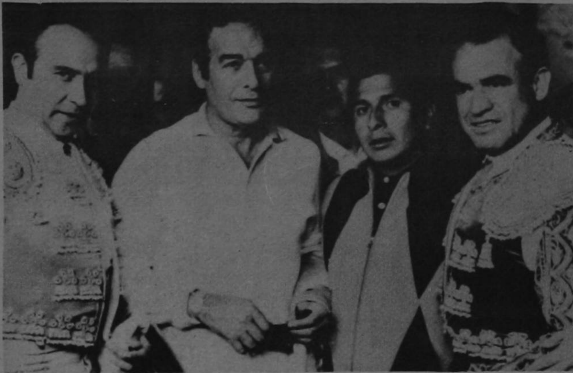
FOTO HISTORICA: En esta gráfica del álbum de Enrique Esparza tomada la tarde en que el inolvidable Luis Procuna se cortó la coleta, aparece también el ya desaparecido artista de cine Jorge Mistral. Con ellos un destacado periodista taurino de aquel hermano país. Esparza se encuentra una vez más entre nosotros y esta noche estará cantando y toreando en las fiestas populares de Desamparados.