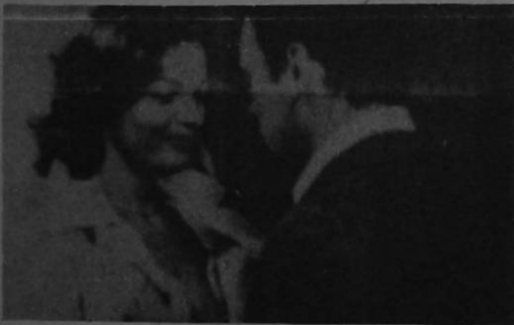
"El cordero enardecido"

JEAN LOUIS TRINTIGNANT - ROMY SCHNEIDER,