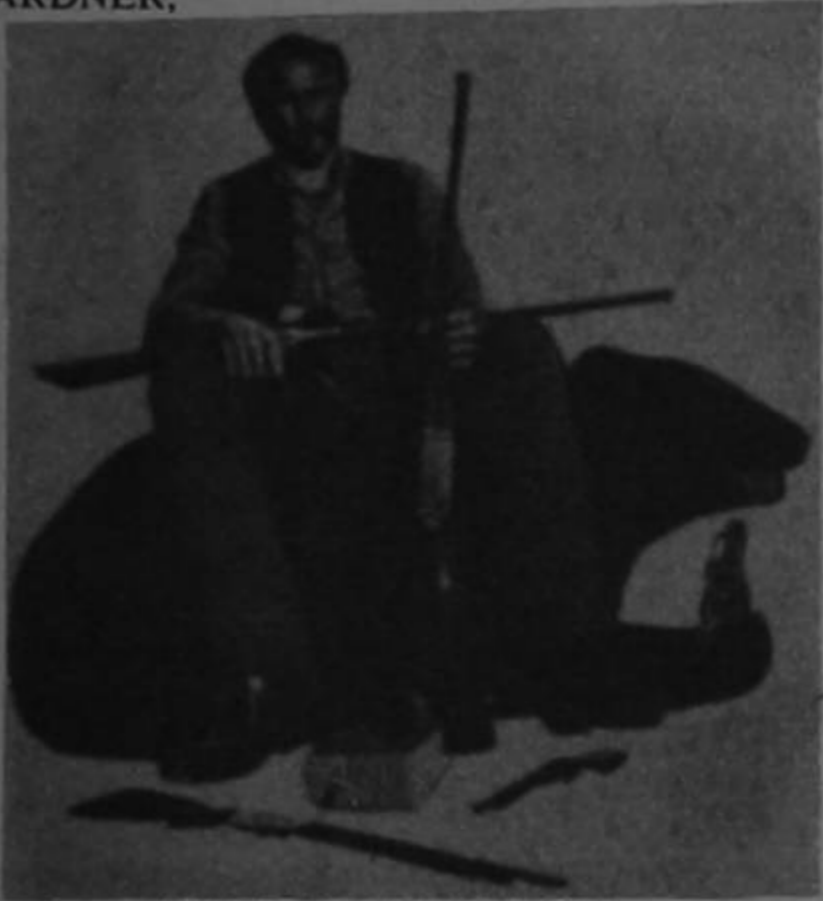
"JUEZ AL PATIBULO" EN COLORES.

PAUL NEWMAN - JACQUELINE BISSET - TAB HUNTER - AVA GARDNER,