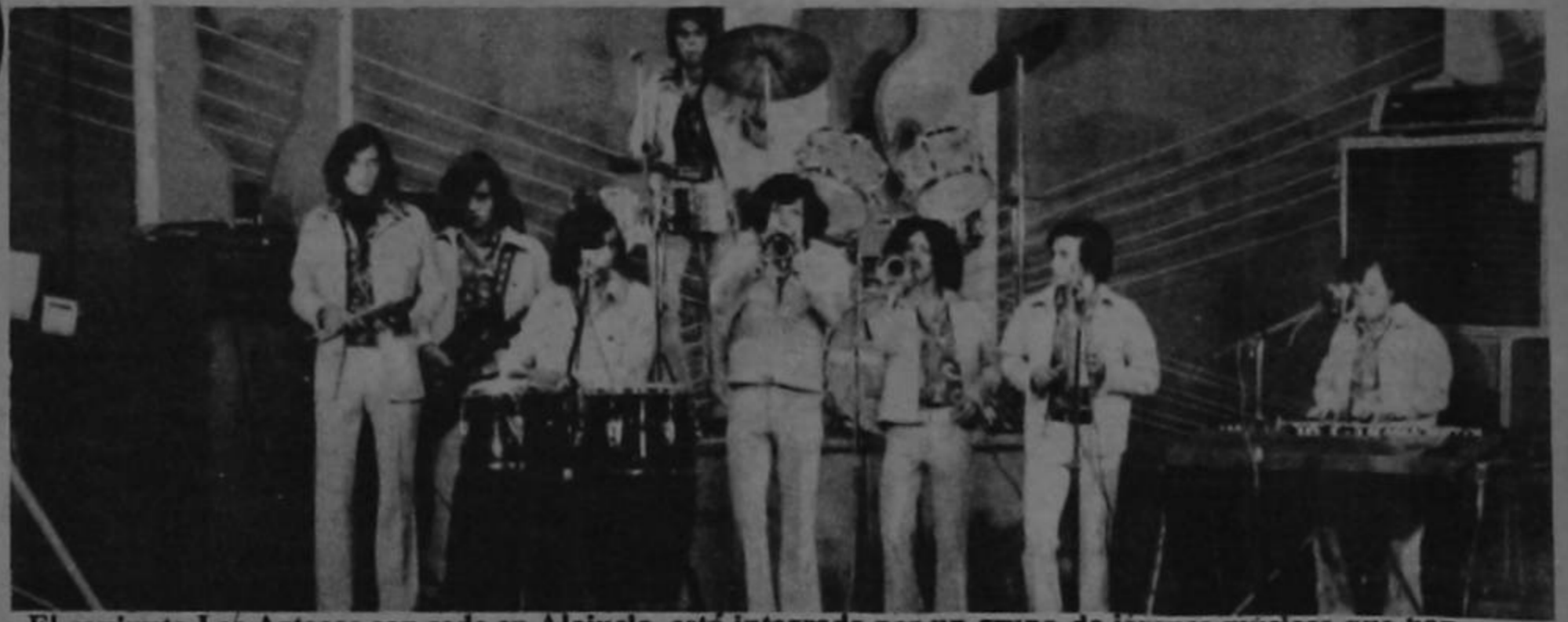
El conjunto Los Aztecas con sede en Alajuela, está integrado por un grupo de jóvenes músicos que han puesto lo mejor de sí para formar una entidad musical con estilo propio. "Sabemos que nos falta mucho camino, pero llegaremos a recorrerlo"; nos dijeron algunos de sus integrantes.-

Por último, la Cámara acude en defensa de la filosofía en que se inspiró la Reforma de la Ley de Comercio de los Estados Unidos de 1974, cual es el estimular sin restricciones al libre comercio, y hace notar que las naciones latinoamericanas, en particular Costa Rica, considerarían la eliminación de las mencionadas partidas arancelarias, como una violación al espíritu de la Reforma de la Ley de Comercio de los Estados Unidos.